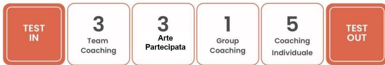
TABELLA A: Test in e Test out ORG EI Q- Giunti Psychometrics (Organizational-Emotional Intelligence Questionnaire)